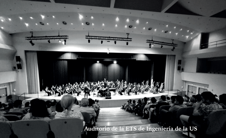
Auditorio de la ETS de Ingeniería de la US